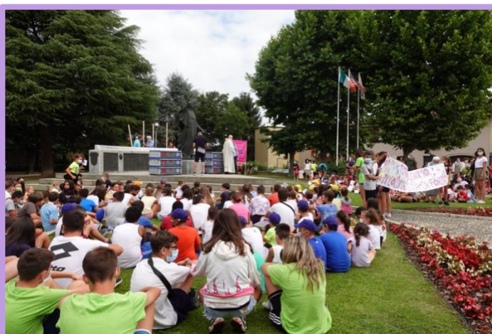
Foto 5. Niños en Sant'Angelo Lodigiano el 15 de julio.

El 15 de julio, nuestro equipo de comunicación tuvo la oportunidad de participar en las celebraciones del nacimiento de la Madre Cabrini en Sant'Angelo Lodigiano. En esta ocasión, la presencia de nuestra fundadora y su legado se hizo sentir de forma tangible, especialmente cuando todos los presentes abrazaron la estatua de Madre Cabrini en la "Piazza XV Luglio".