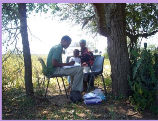
Foto 2. Atendiendo a la población en Eswatini.

La tesis identifica el amor como el elemento constitutivo de la tradición Ignaciana. El amor es comparado con la raíz principal del árbol, de la que parten todas las demás raíces. La palabra "Magis" se utiliza para representar la comprensión de que estamos llamados a ser parte de la acción amorosa de Dios en el mundo. Magis es una palabra latina que significa más o mayor, y está tomada del lema de la Compañía de Jesús "para mayor gloria de Dios".