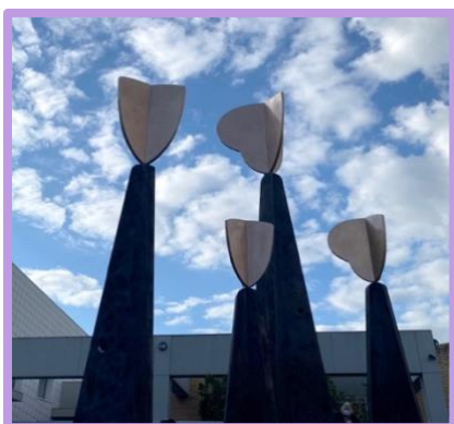
Foto 8. La escultura "Vigilia - el corazón de Cabrini" en Australia.

Vigilia - El corazón de Cabrini se instaló en Cabrini Malvern en septiembre y se celebrará oficialmente durante las semanas de Cabrini, cuando celebremos muchas ceremonias alrededor de la fiesta de Santa Francisca J. Cabrini.