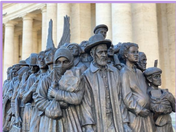
Foto 1. "Ángel Unwares", el monumento de la Plaza de San Pedro dedicado a los migrantes y refugiados.

Ya la Madre lo decía, y los sigue diciendo, precisamente, cuando en los escritos se refiere a