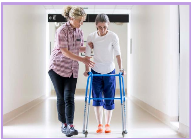
Foto 6. Personas que prestan servicio en los centros sanitarios de Australia.

El proyecto Hope and Human Flourishing in the Workplace (Esperanza y Florecimiento Humano en el Lugar de Trabajo) , puesto en marcha en julio de este año, hace hincapié en cómo las oportunidades de empleo dentro de Cabrini Support Services proporcionan una esperanza muy necesaria para muchos después de abandonar sus países de origen. La oportunidad de prosperar, mantener a sus familias y recuperar un sentido de identidad ha permitido a muchos empleados recuperar su dignidad y sentirse de nuevo parte de una comunidad. Las inspiradoras historias de once de nuestros empleados expresan una verdadera esencia de amor y pueden leerse aquí .