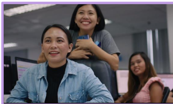
Foto 4. Un fragmento del vídeo "Cuando Dios ruge" de la empresa de Filipinas mencionada en el artículo.

Intentamos alinear ampliamente las inversiones principales del Instituto con los valores de nuestra congregación. Esto implica excluir las inversiones que no sean coherentes con los valores católicos, seleccionar acciones y bonos con los mejores registros sociales, medioambientales y de gobernanza, y ejercer nuestros derechos de accionista para abogar por cuestiones de interés social y ético.