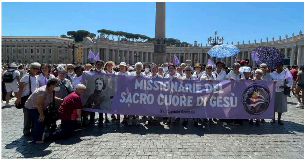
Las MSC en el Ángelus del Papa Francisco en la Plaza de San Pedro.

El primer fin de semana fue muy intenso y hermoso. Algunas hermanas y laicos fueron de excursión al Palacio Real de Caserta , en Campania. Con la ayuda de un guía, recorrimos los