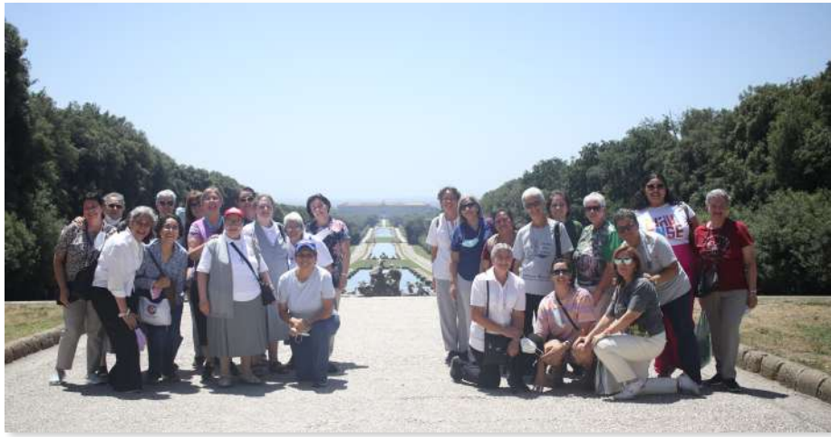
Hermanas y laicos en un viaje al Palacio Real de Caserta, Campania.

“En este XVI Capítulo General, experimentamos la llamada de Dios a ser instrumentos de paz y amor. Caminamos juntas, juntos, y nos comprometemos a testimoniar al mundo que formamos una comunidad global, inclusiva, eclesial, sinodal. Creemos que uno de los pilares de este camino es la escucha y la acogida, la corresponsabilidad entre Hermanas, entre Hermanas y Laicos, entre Laicos. Un nuevo camino del Espíritu Santo comenzó con Madre Cabrini. Un nuevo comienzo para nosotros, hoy, en la búsqueda de la unidad que nos exige una transformación interior y exterior. Un nuevo comienzo para abrazar nuestras vulnerabilidades y servir con amor a los más vulnerables, respondiendo a los desafíos emergentes del mundo de hoy .”