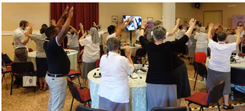
Hermanas y laicos durante un momento de oración.

Los días 7 y 8 de julio, los participantes en el Capítulo, hermanas y laicos, compartimos la pregunta ¿Qué hemos descubierto de todo lo que se ha hablado hasta ahora durante el Capítulo? ¿Qué hemos escuchado que consideramos particularmente importante para el futuro del Instituto y su misión global? Cada mesa planteó los temas clave para el Instituto y la Misión, tratando de aclarar las prioridades para nuestras reflexiones y debates adicionales. La