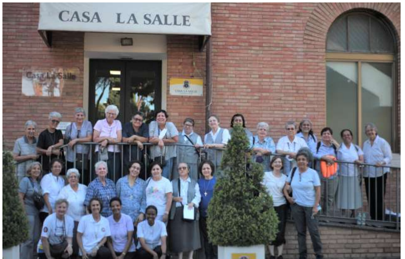
MSC en la Casa La Salle durante uno de los fines de semana del Capítulo General.

Este tiempo nos dio la oportunidad de ver aún más el testimonio de los laicos al compartir la experiencia de nuestro Carisma, concretado en las misiones: con los sin techo, con los migrantes en Texas, en la frontera con México, en la pastoral educativa, en la época del Covid-19, en la promoción de la dignidad de las personas. En todo esto, percibimos el amor misericordioso y la compasión del Carisma Cabriniiano.