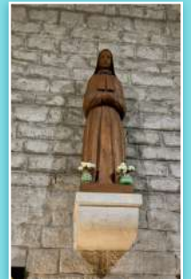
Estatua de madera de la Madre Cabrini en la basilica de Santa María del Mar.