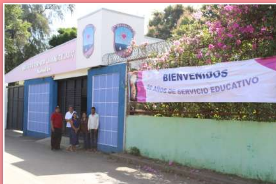
Instituto Técnico La Inmaculada.

Las MSC comenzaron a tejer esta historia en un barrio rural de la capital: Pochocuape y Loma Linda, e iniciaron en 1974 con el sueño de ayudar a adolescentes y jóvenes en su preparación educativa y técnica. Esta labor comenzó después del terremoto de Managua de diciembre de 1972 y hoy se extiende desde el jardín de infantes hasta el bachillerato, gracias a las Misioneras del Sagrado Corazón que han entregado todo su amor, dedicación y entusiasmo a lo largo de todos estos años.