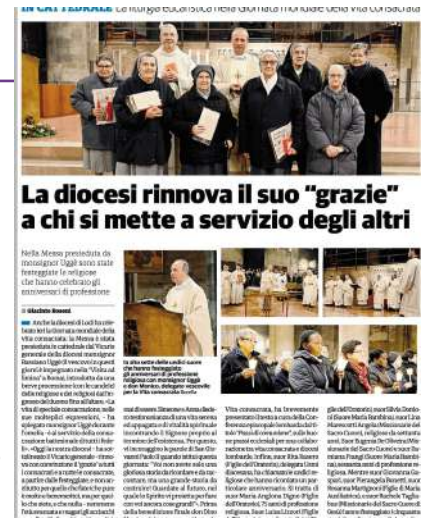
La diocesi rinnova il suo "grazie" a chi si mette a servizio degli altri

Página de "Il cittadino di Lodi" sobre la liturgia eucarística del 2 de febrero celebrada en la catedral.