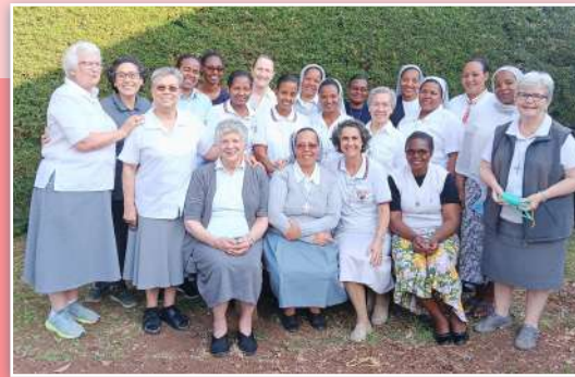
Todas las Hermanas MSC presentes en las celebraciones en Etiopía.