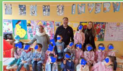
Visita a la escuela de Sant'Angelo Lodigiano.