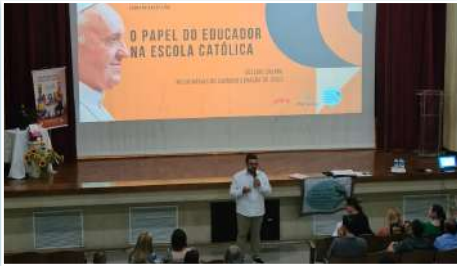
Formación sobre el tema de la "Campaña de Fraternidad 2024" en Brasil.