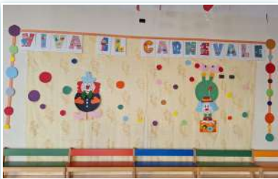
Carnaval en la escuela de Sant'Angelo Lodigiano.

Las clases se impartirán según el grupo asignado.