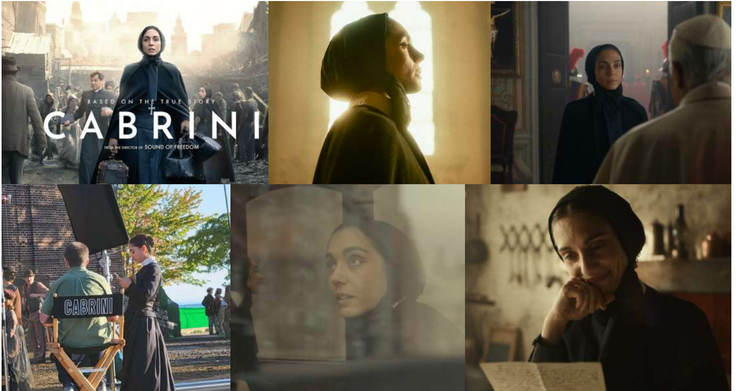
De izquierda a derecha: el cartel y algunas fotos del rodaje de la película "Cabrini", de Alejandro Monteverde.