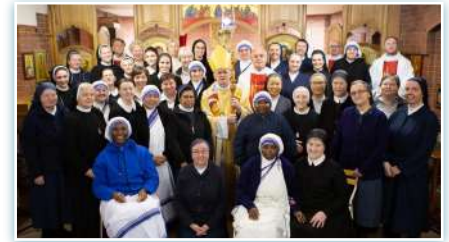
Encuentro intercongregacional de religiosas de la diócesis de Novosibirsk.