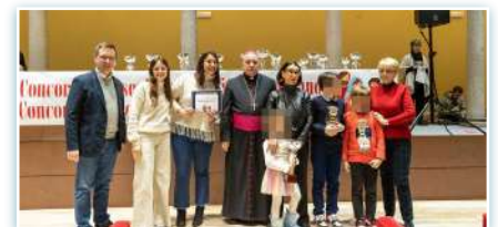
Ceremonia de entrega del primer premio del concurso de belenes de Milán.

* El 10 de enero, los miembros de Cabrini Immigrant Services CIS-NYC se sumaron a la New York Immigration Coalition (NYIC) (Coalición de Inmigración de Nueva York) y a otras organizaciones en