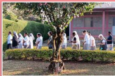
Rezo del Santo Rosario en la misión de Dubbo.