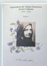
Portada V tome.

En este día celebramos uno de los ministerios más importantes para nuestro Instituto. ¡Gracias a quienes en el mundo cabriniano dedican su vida a ello! ¡El apostolado de la "educación del corazón" de Madre Cabrini sigue existiendo todavía hoy.