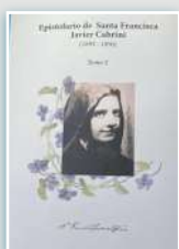
Capa V tomo.

Nesse dia, celebramos um dos mais importantes ministérios para o nosso Instituto. Agradecemos àqueles que, no mundo cabriniano, dedicam suas vidas a ele! Ainda hoje, o apostolado de Madre Cabrini de "educação do coração" continua!