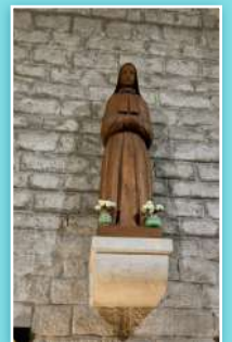
Estátua de madeira de Madre Cabrini na basílica da Igreja de Santa Maria del Mar.