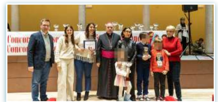
Cerimônia de premiação do primeiro prêmio do concurso de presépios em Milão.

* No dia 7 de janeiro, por ocasião do Batismo de Jesus, quando as festividades de Natal tinham acabado de terminar, o Instituto Madre Cabrini de Milão participou do concurso de presépios na Diocese de Milão, ganhando o primeiro prêmio. A foto mostra a cerimônia de entrega dos prêmios do Concurso organizado pela Cúria de Milão. Parabéns!