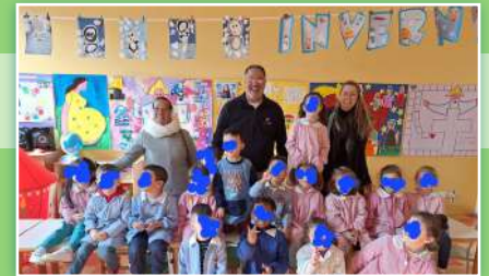
Visita à escola em Sant'Angelo Lodigiano.