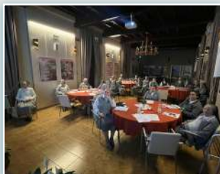
Fotos da Assembleia Mater Gratiae.

A Assembleia Provincial Mater Gratiae foi realizada de 12 a 16 de janeiro . Durante as reuniões, as irmãs e os leigos traçaram as diretrizes para o próximo triênio. Em seguida, as várias missões tiveram a oportunidade de apresentar seus trabalhos e atividades. Em uma atmosfera fraterna e compartilhada, o espírito cabriniano foi muito apreciado e o grupo de missionários leigos, um grupo que está crescendo cada vez mais na Província, foi acolhido com grande confiança.