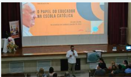
Treinamento sobre o tema da "Campanha da Fraternidade 2024" no Brasil.

* Em 29 de janeiro, a Cabrini Mission Foundation lançou sua bolsa de estudos 2024 para estudantes em Nova York.