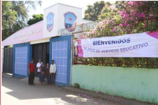
Instituto Técnico La Inmaculada.

Francisca Cabrini. As MSC começaram a tecer essa história em um bairro rural da capital: Pochocuape e Loma Linda, e iniciaram em 1974 com o sonho de ajudar adolescentes e jovens em sua preparação educacional e técnica. Essa obra teve início após o terremoto de Manágua, em dezembro de 1972, e hoje se estende do jardim de infância ao ensino médio, graças às Missionárias do Sagrado Coração, que deram todo o seu amor, dedicação e entusiasmo ao longo dos anos.