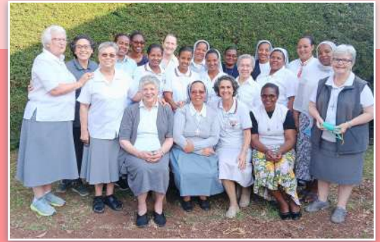
Todas as irmãs MSC presentes nas celebrações na Etiópia.

também de outras partes do Instituto para essa ocasião. A alegria e a simplicidade da celebração tocaram os corações de todas as participantes. A celebração foi realizada na paróquia de Dubbo, Nossa Senhora de Lourdes, e foi presidida pelo bispo Emiratus Tsegaye Keneni (ex-bispo do Vicariato Apostólico de Soddo). No final da Missa, houve uma grande celebração com comida, danças e a tradicional cerimônia do café. A emissora PAX CTV transmitiu toda a celebração eucarística.