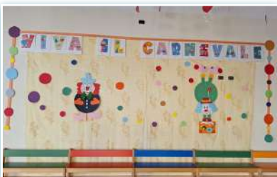
Carnaval na escola Sant'Angelo Lodigiano.

* Em 5 de fevereiro, no Dispensário Madre Cabrini , teve início o programa Shekinà com a primeira reunião de pais, inaugurando um novo ano de acompanhamento e incentivo para meninas e meninos. As aulas serão ministradas de acordo com o grupo designado.