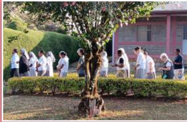
Recitação do Santo Rosário na missão de Dubbo.