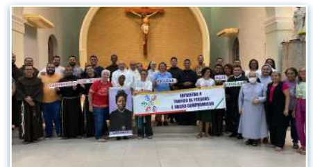
Comemoração do Dia Mundial de Combate ao Tráfico de Pessoas no Centro da Juventude no Brasil.