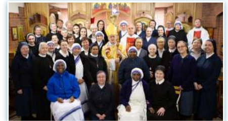
Reunião intercongregacional de religiosas da diocese de Novosibirsk.