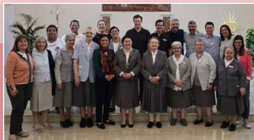
Foto de grupo al final de las reuniones en Via Sicilia.