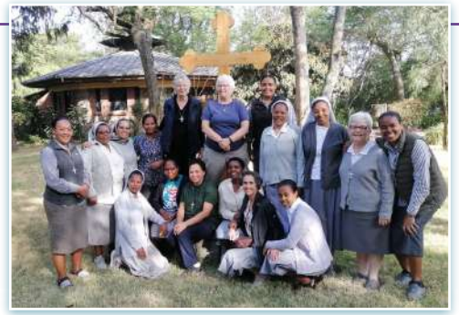
Reunión de hermanas en el Centro Galilea de Etiopía.