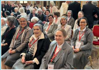
Audiencia tras el curso "Reparar lo irreparable".

Del 1 al 5 de mayo, el Consejo General y otras Hnas. participaron en el curso "Reparar lo irreparable" organizado en Roma por el Santuario del Sagrado Corazón de Paray-Le-Monial. Este ciclo de encuentros, conferencias y mesas redondas se organizó con motivo del Jubileo del Sagrado Corazón y de los