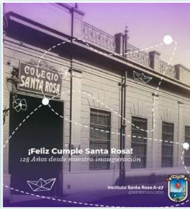
Tarjeta de aniversario del Instituto Santa Rosa.

* Cabrini Guatemala realizó diferentes actividades entre abril y mayo. Durante el mes de abril en los Dispensarios se realizaron varias actividades: un taller de formación y emprendimiento para mujeres diplomadas en costura, un taller de decoración floral, ejercicios de fisioterapia para mujeres embarazadas y el proyecto de psicología destinado al programa Senior . En mayo se llevaron a cabo actividades de grupos como el Grupo Falò , un proyecto de asistencia familiar para adolescentes y padres, para recibir asesoramiento sobre salud mental y emocional. La actividad de los huertos escolares, sobre nutrición y seguridad alimentaria y luego dos actividades para el Día de la Madre, con presentaciones para toda la familia, música tradicional Marimba y juegos para festejar a todas las madres que participan en los programas de los Dispensarios.