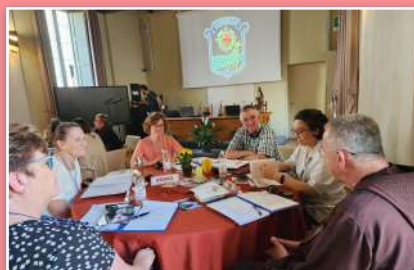
Grupo de trabajo en las reuniones del santuario de Codogno.