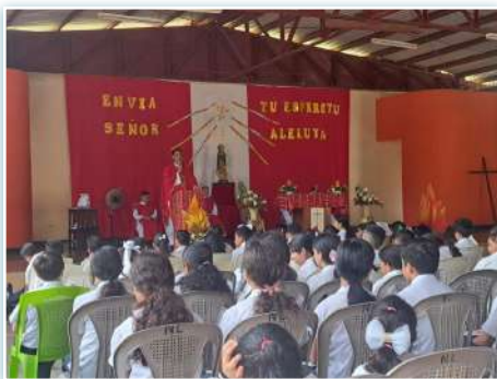
Celebración de Pentecostés en Nicaragua.

* El sábado 18 de mayo, los misioneros laicos cabrinianos se reunieron en Argentina en la Comunidad de Betania en CABA.