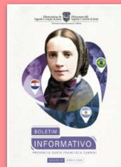
Portada del primer boletín.

Comunicamos con gran alegría que en el día del Sagrado Corazón de Jesús se ha publicado la primera edición del Noticiero de la Provincia Santa Francesca Cabrini. El objetivo de esta publicación es dar a conocer aún más la obra de las Hermanas Cabrini entre los corresponsables laicos en Argentina, Brasil y Paraguay, así como transmitir el legado de amor y celo misionero de nuestra fundadora, Madre Cabrini. El boletín está en portugués y español.