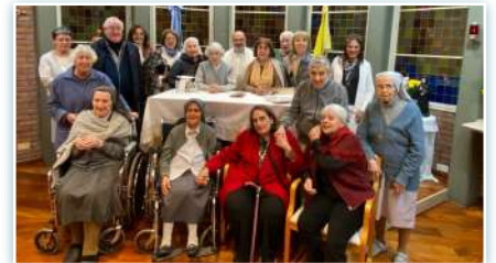
Reunión de laicos en la Comunidad de Betania.

* En mayo, 10 profesores de la guardería de Dubbo, Etiopía, participaron en un curso de 3 semanas de literatura impartido por la Oficina de Educación del gobierno local etíope.