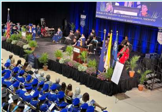
Ceremonia de graduación en la Universidad Cabrini.