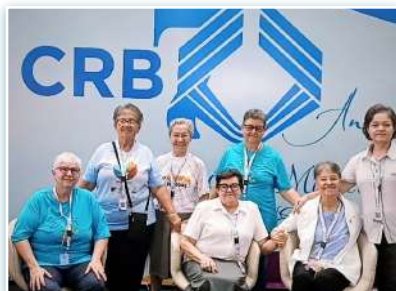
Incontro CRB nazionale in Brasile.

CIS-NYC hanno partecipato all'incontro annuale organizzato negli Stati Uniti da CLINIC (Catholic Legal Immigration Network) . Mentre il 2 giugno CIS-NYC si è unito alla 21esima camminata annuale sul Sentiero degli Immigrati.