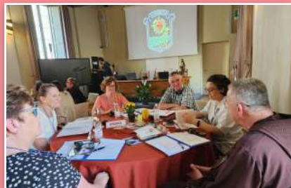
Gruppo di lavoro agli incontri dei santuari a Codogno.

A maggio si è svolto un incontro economico amministrativo, che è stato arricchito anche dalla presenza via Zoom del professor Luigino Bruni, che ha fatto un intervento sulla dimensione economica nelle comunità.