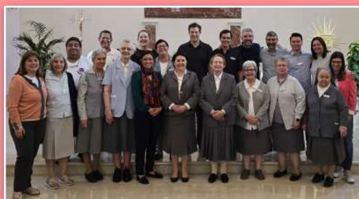
Foto di gruppo al termine degli incontri a via Sicilia.

Dall'11 al 14 giugno si è tenuto a Codogno il primo incontro internazionale dedicato ai santuari e ai centri di spiritualità. Vi hanno partecipato l'intero Consiglio Generale e diverse Sr.e e responsabili laici dei vari paesi. Si è parlato di come mantenere vivi questi centri, rendendoli sempre più luoghi di missione, dando priorità all'evangelizzazione e al renderli luoghi da cui far scaturire i frutti dell'eredità di Madre Cabrini.