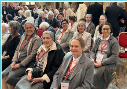
Udienza dopo il corso "Riparare l'irreparabile".

Dal 1 al 5 maggio il Consiglio Generale e altre Sr.e hanno partecipato al corso "Riparare l'irreparabile" organizzato a Roma dal Santuario del Sacro Cuore di Paray- Le-Monial. Questo ciclo di incontri, conferenze e tavole rotonde è stato organizzato in occasione del Giubileo del Sacro Cuore e dei 350 anni delle apparizioni a Santa Margherita Maria Alacoque, per cui Madre Cabrini ha avuto una speciale devozione. Questa esperienza è stata impreziosita il 4 maggio con l'essere ricevute in Udienza dal Santo Padre.