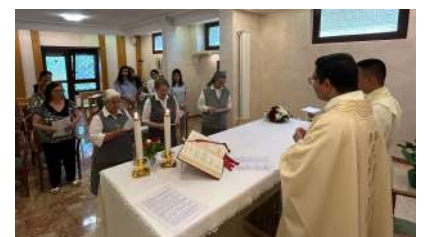
Celebrazione eucaristica nella Curia Generalizia di Roma.