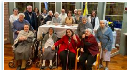
Incontro dei laici presso la Comunità di Betania.

* Sabato 18 maggio i missionari laici cabriniani si sono riuniti in Argentina presso la Comunità di Betania a CABA.