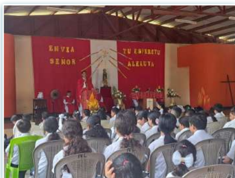
Celebrazione di Pentecoste in Nicaragua.

* Il 19 maggio, giorno di Pentecoste, presso il Collegio La Inmaculada in Nicaragua, si è tenuta la Celebrazione Eucaristica di Pentecoste e la consacrazione di 30 lettori. Tutta la comunità è grata per il sostegno e l'appoggio delle famiglie e degli studenti che si impegnano nel servire Dio attraverso gli altri. Il giorno successivo, si è tenuto un incontro di formazione per i collaboratori laici dell' Istituto Tecnico La Inmaculada , Escuela Sagrada Familia n 1 e l'Edificio Diriamba .