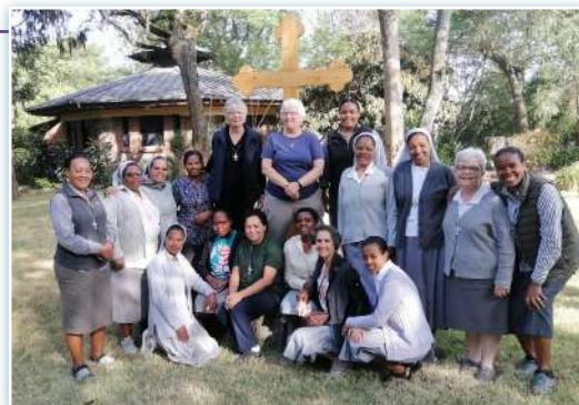
Incontro delle Suore presso il Galilee Center in Etiopia.