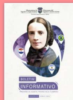
Copertina del primo bollettino.

Comunichiamo con grande gioia che nel giorno del Sacro Cuore di Gesù è uscita la prima edizione del Notiziario della Provincia Santa Francesca Cabrini. L'obiettivo di questa pubblicazione è quello di far conoscere ancora meglio l'opera delle Sr.e Cabrini tra i corresponsabili laici in Argentina, Brasile e Paraguay, nonché di trasmettere l'eredità di amore e di zelo missionario della nostra fondatrice, Madre Cabrini. Il bollettino è in lingua portoghese e spagnola.