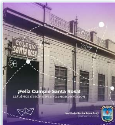
Card per anniversario Istituto Santa Rosa.

* Diverse le attività tra aprile e maggio di Cabrini Guatemala. Durante il mese di aprile nei Dispensari si sono tenuti un laboratorio di formazione e imprenditorialità per donne diplomate in cucito, un workshop di decorazione floreale, esercizi di fisioterapia per le donne in gravidanza e il progetto di psicologia rivolto al programma Senior. Nel mese di maggio sono state portate avanti le attività di gruppi come il Gruppo falò, un progetto di assistenza per la famiglia, per adolescenti e genitori, per ricevere consulenza sulla salute mentale ed emotiva. L'attività degli orti scolastici, su nutrizione e sicurezza alimentare e poi due attività per la Festa della mamma, con presentazioni per tutta la famiglia, musica tradizionale Marimba e giochi per celebrare tutte le mamme che partecipano ai programmi dei Dispensari.