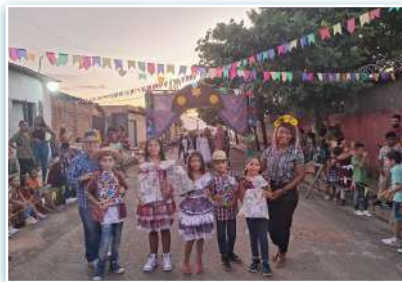
Festa "Arraia da Cabrini".