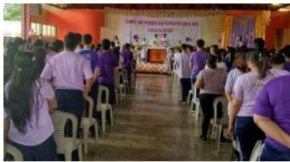
Messa Istituto Tecnico La Inmaculada, Nicaragua.