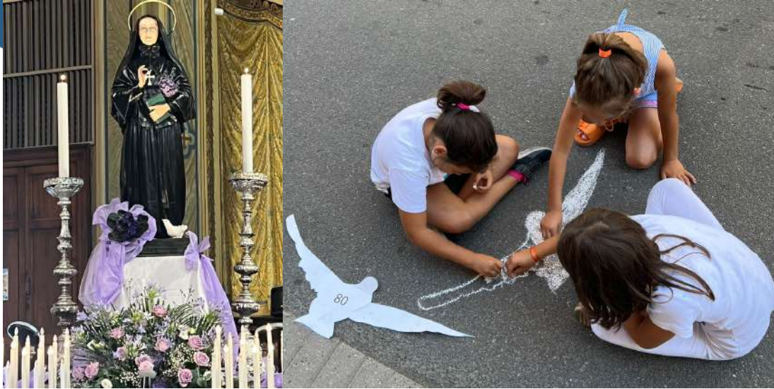
In questo riquadro l'immagine delle colombe per le strade di Codogno e la statua di Madre Cabrini presso la Basilica di Sant'Angelo Lodigiano.

Missionarie del Sacro Cuore di Gesù | Luglio - Agosto 2024 | www.cabriniworld.org