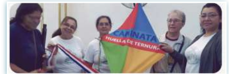
Camminata contro la violenza infantile e adolescenziale.