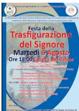
Locandina dei festeggiamenti per la Trasfigurazione.

Il 6 agosto scorso presso la Chiesa del Tabor al Centro di Spiritualità di Codogno si è tenuta una grande celebrazione in occasione della Festa della Trasfigurazione del Signore. La cerimonia presieduta da Mons. Malvestiti è stata ancora più importante poiché questa data ha sancito l'inizio dell'anno del Centenario della Chiesa del Tabor. Si è tenuto poi un incontro intitolato Madre Cabrini e la preghiera di Monsignor Passerini e la proiezione di un video sulle testimonianze missionarie a 100 anni dalla Consacrazione. Ringraziamo il Signore per questo tempo intenso di comunione e condivisione!