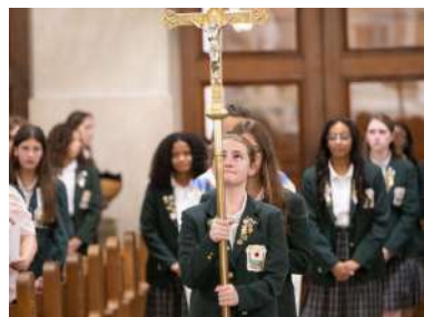
S. Messa al Cabrini High School New Orleans.

diocesi. È stata una serata di preghiere, riflessione, pellegrinaggio, confessioni, danze, gioia, il tutto coronato dall'esperienza dell'Eucaristia.