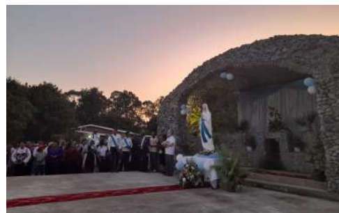
Uno scatto durante la veglia per la Festa dell'Assunzione di Maria in eSwatini.

Il 6 agosto scorso presso la Chiesa del Tabor al Centro di Spiritualità di Codogno si è tenuta una grande celebrazione in occasione della Festa della Trasfigurazione del Signore. La cerimonia presieduta da Mons. Malvestiti è stata ancora più importante poiché questa data ha sancito l'inizio dell'anno del Centenario della Chiesa del Tabor. Si è tenuto poi un incontro intitolato Madre Cabrini e la preghiera di Monsignor Passerini e la proiezione di un video sulle testimonianze missionarie a 100 anni dalla Consacrazione. Ringraziamo il Signore per questo tempo intenso di comunione e condivisione!