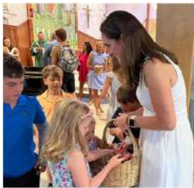
Distribuzione di caramelle al Santuario in Colorado.

tocco di dolcezza all'occasione. La celebrazione è stata trasmessa in diretta streaming, permettendo a tutto il mondo di partecipare.