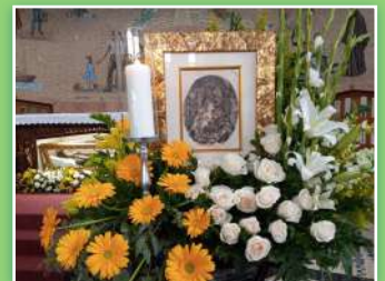
Addobbi sull'ambone del Santuario.