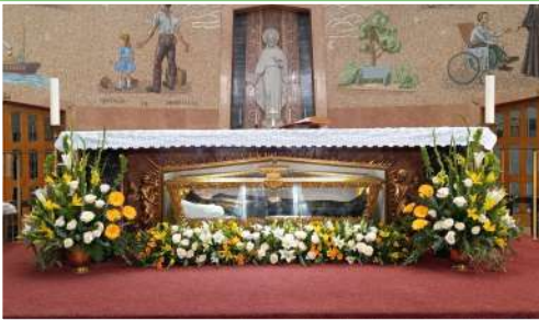
Addobbi sull'altare del Santuario.