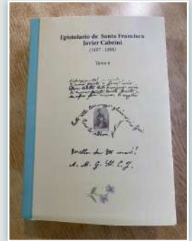
Il VI tomo dell'Epistolario.