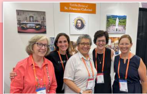
Alcune rappresentanti dei santuari presso lo stand 1150 del Convegno Eucaristico.

Il recente Congresso Eucaristico di Indianapolis, negli Stati Uniti, dal 17 al 20 luglio ha riunito quasi 60.000 persone in una potente manifestazione di fede e di unità. Tra i partecipanti c'erano diversi membri del personale dei Santuari di New York e del Colorado, insieme a Sr. Yolanda Flores, MSC. I Santuari hanno esposto una mostra che invitava i presenti a scattarsi un selfie con un ritaglio della stessa Madre Cabrini. Questo elemento interattivo ha aggiunto un tocco giocoso e ha favorito un legame personale con la nostra amata Santa. Molti di coloro che hanno visitato lo stand hanno raccontato di aver visitato i Santuari o di sperare di visitarlo e di aver apprezzato il recente film su Madre Cabrini. La risposta entusiasta dei partecipanti ha dimostrato un profondo apprezzamento per la vita e i contributi straordinari della Santa, consolidando ulteriormente l'importanza di preservare e condividere la sua storia.