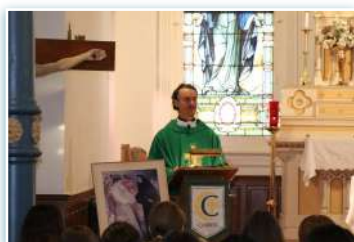
S. Messa presso il Cabrini High School New Orleans.