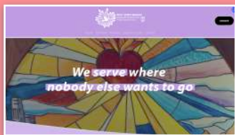
Pagina iniziale del nuovo sito.