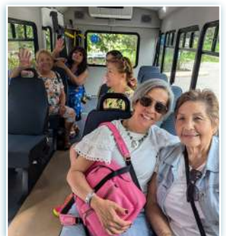
Visita alla Casa di Cura S. Cabrini del gruppo CIS-NYC.