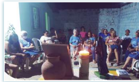
Comunità Nostra Signora delle Grazie a Teresina.

Il giorno 15 luglio anche la Comunità Nostra Signora delle Grazie a Teresina in Brasile ha celebrato l'anniversario della nascita di Santa Francesca Cabrini. Le Suore si sono riunite con la comunità locale per pregare e festeggiare questa data significativa.