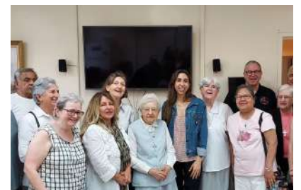
Festeggiamenti nel Santuario di New York.