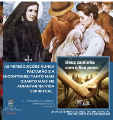
Cartão para celebrar o Dia Mundial dos Migrantes e Refugiados, pelo Santuário de Nova York, Cabrini Immigration Services e a Cúria.