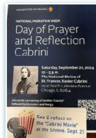
Cartaz do evento do Santuário St. Frances Cabrini.