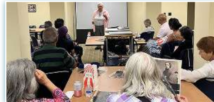
Santuário Nacional Cabrini em Chicago.