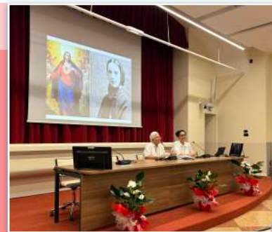
Encontro de Formação de Irmãs e Leigos em Roma.