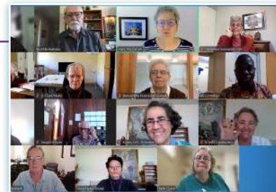
Conferência de Formação Religiosa do Incontro.

Realizou uma sessão de formação com os chefes dos vários departamentos sobre como diversificar as fontes de financiamento e como melhorar a redação e a gestão de subsídios. Realizou sessões de formação com o grupo de trabalho de comunicação sobre como recolher e partilhar informações a publicar no site da Região. Ela também passou algum tempo nas comunidades ao redor de St. Philip, acompanhando as Irmãs e a equipe de Cabrini Ministries em suas atividades