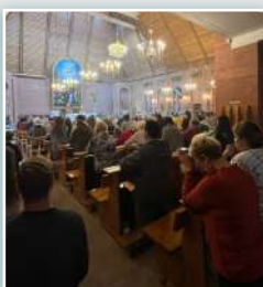
Preghiera per la pace a Novosibirsk.