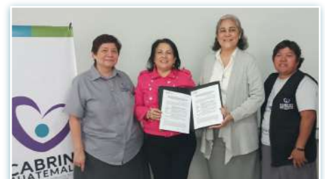
Reconhecimento para a zona do Dispensário San Jose6.