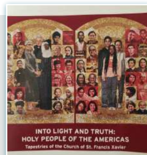
Pôster para instalação de tapeçarias na igreja em Manhattan.

Na tapeçaria, está retratada Santa Francisca Cabrini, e o artista é John Nava. As pessoas retratadas nas tapeçarias são pessoas que trabalharam e deram suas vidas para promover a justiça bíblica, os direitos humanos e a igualdade.