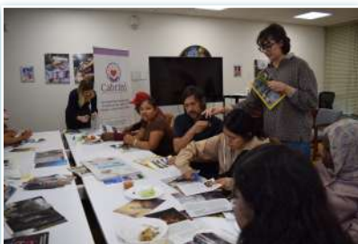
Cabrini Immigrant Services em Nova York.