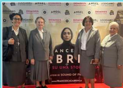
O Conselho Geral na pré-estreia do filme Cabrini no Cinema Adriano.