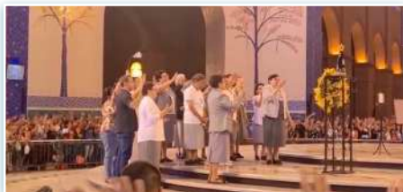
Celebração dos arcanjos no Santuário Nacional de Aparecida.