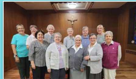
Grupo de Irmãs na comunidade de Nova York.

Na Itália, por ocasião do Dia Mundial do Migrante e do Refugiado, no domingo 29 de setembro, foi realizada em Codogno, na Sala Cabrini do Centro de Espiritualidade, a exibição do filme "Francesca Cabrini", de Alejandro