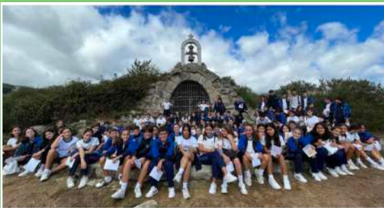
Os meninos do Colégio Cabrini em Madri.

Em preparação para o Jubileu de 2025, foram realizados dias de formação no Colégio Cabrini , em Madri, onde as crianças do ensino fundamental também visitaram a casa das MSC. Houve momentos de leitura do Evangelho e partilha de reflexões. Em uma etapa do curso de formação, as crianças também caminharam da residência de Los Molinos até a ermida da Madonna dell’Espino.