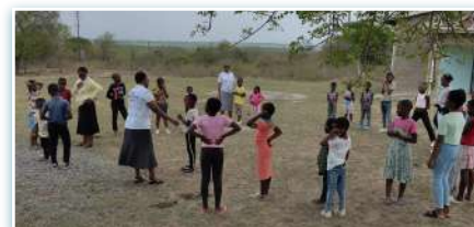
Candidatos da MSC com filhos na missão.