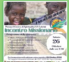
Pôster para reunião organizada pela “ Missione Cabriniana Oggi ”.